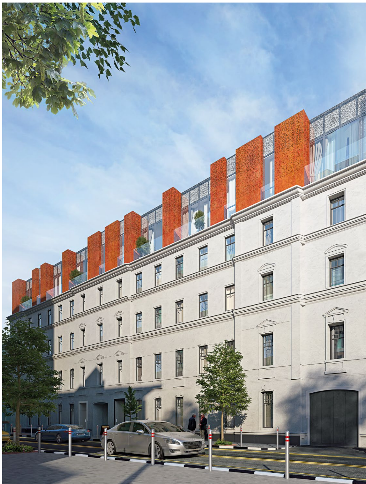
ФАСАД ДОМА С УЛИЦЫ МАШКОВА