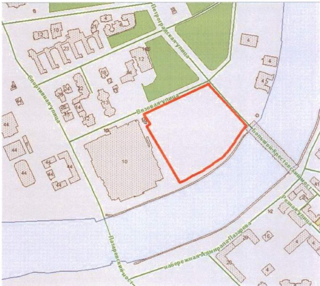
СХЕМА РАЗМЕЩЕНИЯ ОБЪЕКТА